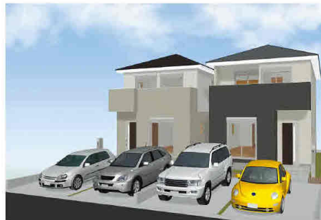
※図面と現況が相違する場合は現況優先とします。